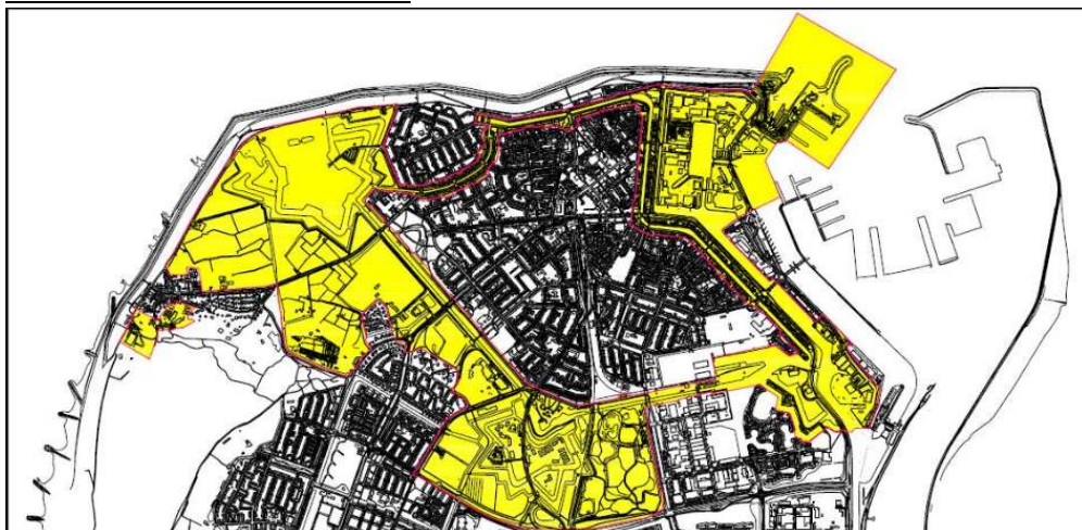
Beschermd stadsgezicht Den Helder